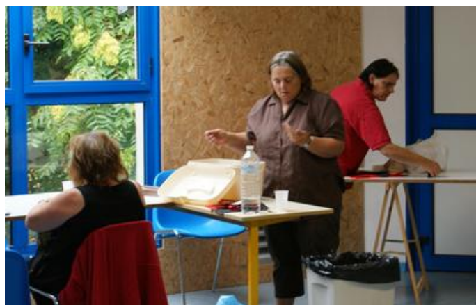
Atelier de Chevreux

A.S.C.V.S. 20, rue Saint Norbert 02880 CUFFIES